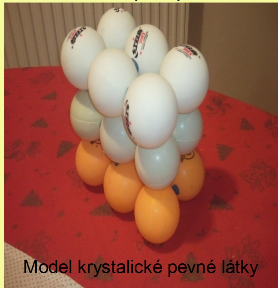
Model krystalické pevné látky