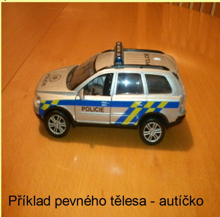
Příklad pevného tělesa - autíčko

Pevné látky - částice uvnitř pevných látek jsou pravidelně uspořádány, což se navenek projevuje vytvářením krystalů. Vzájemné silové působení částic omezuje jejich pohyb. Silové působení brání změně tvaru, velikosti a rozměrů pevných těles.