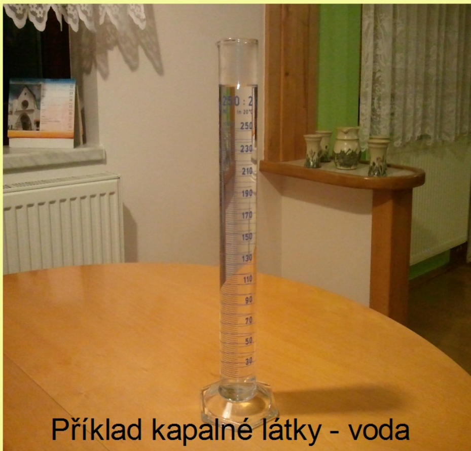
Příklad kapalné látky - voda

Kapalné látky - částice uvnitř kapalných látek nejsou pravidelně uspořádány a mohou se vzájemně snadněji přemísťovat než v pevných látkách. Proto kapaliny snadno mění svůj tvar, na povrchu vytvoří vodorovnou hladinu a jsou tekuté. Protože jsou částice kapalin blízko u sebe, jsou kapaliny prakticky nestlačitelné.