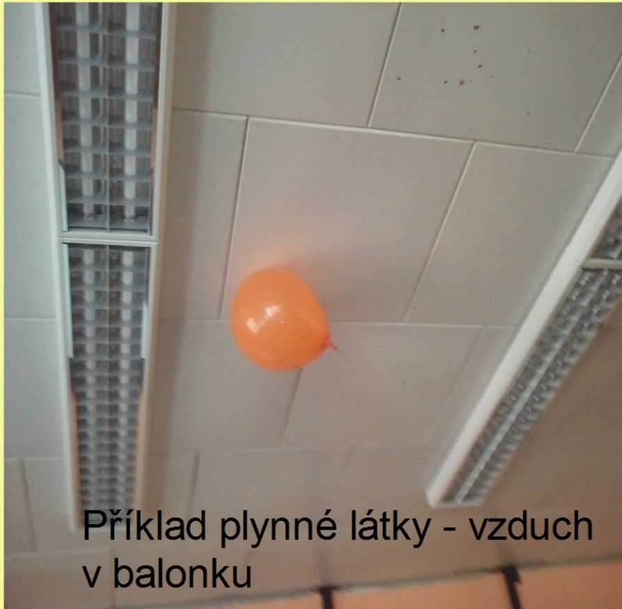
Příklad plynné látky - vzduch v balonku

Plynné látky - částice uvnitř plyných látek se pohybují volně a zcela neuspořádaně. Vzájemně na sebe působí jen zcela nepatrnými přitažlivými silami. Proto jsou plyny rozpínavé a snadno stlačitelné. Po určité době vyplní nejen celou nádobu, ale i např. místnost apod.